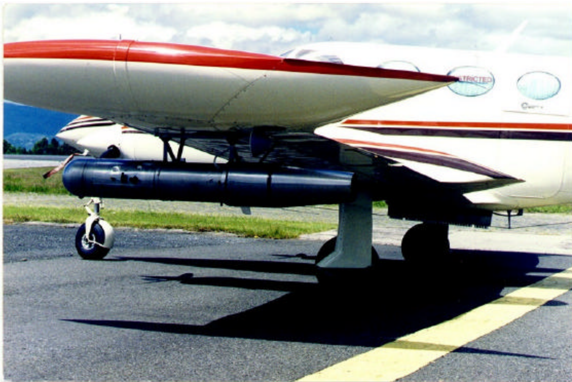
Figura 2 Generador de Acetona-Yoduro de Plata y Portabengalas de Yoduro de Plata por Goteo