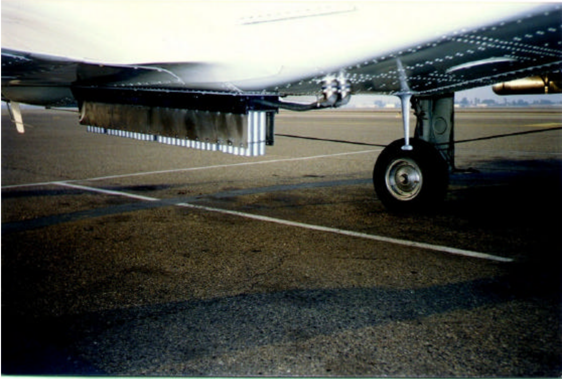
Figura 1 Portabengalas de Yoduro de Plata por Goteo