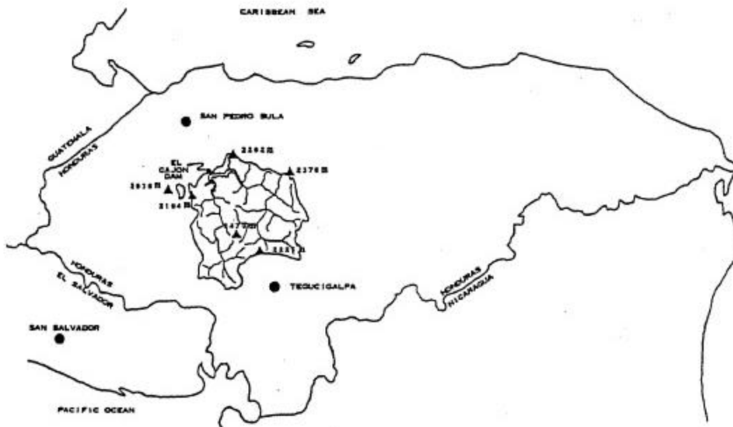
Figura 3 Embalse El Cajón, Honduras

Como centro de las operaciones del programa se utilizó un radar meteorológico dedicado de 5 cm. El radar y el avión operaban desde San Pedro Sula en apoyo al programa del Embalse El Cajón (Figura 3). En las primeras dos estaciones del programa la información del tiempo fue suministrada por la oficina de TRC NAWC en Salt Lake City, Utah, EE.UU., mediante computadora y modem. En 1994 se agregó una tecnología que permitía obtener fotografías de satélites meteorológicos en tiempo casi real para toda la zona de América Central y el Caribe. Asimismo, en 1997 el programa pudo contar con una computadora personal para tener acceso a Internet y disponer de una variedad de productos meteorológicos.